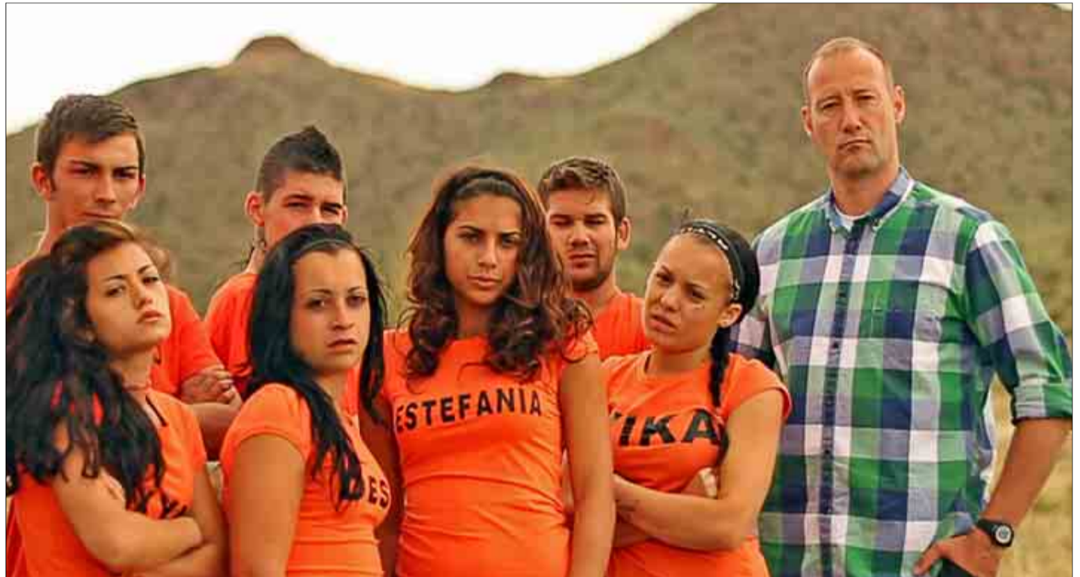
Pedro García Aguado, con los jóvenes con trastornos a los que ayudará a rehabilitarse en el programa 'El campamento'.

— El momento en el que la realidad es tan aplastante que ya no puedo justificar de ninguna manera comportarme así. Eso es un toque de inteligencia importante. La inteligencia puede ser la que utilizas para pensar y saber escribir, pero también está la inteligencia adaptativa.